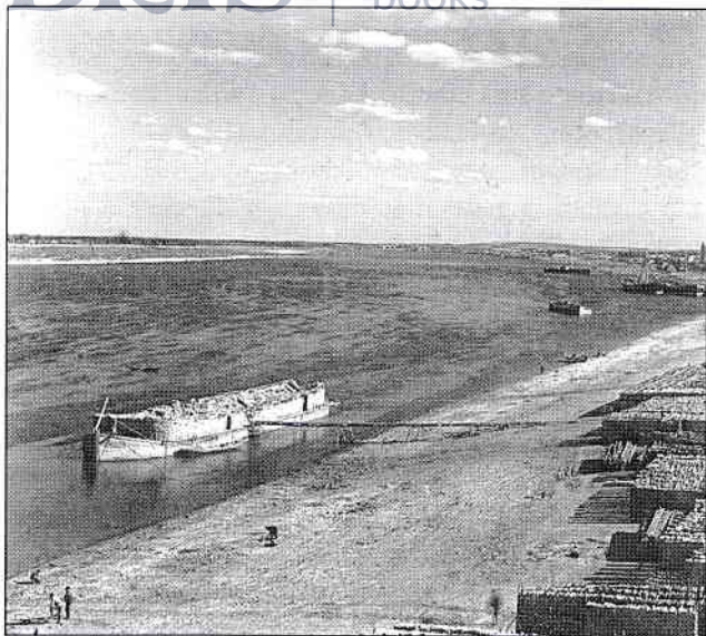
Figura 1.1 Trafic cu barje, în anii 1890, pe fluviul Volga, una dintre arterele comerciale importante încă din cele mai vechi timpuri

prăbușirea Uniunii Sovietice (cunoscută și sub numele de URSS 2 ) și la nașterea a cincisprezece state 3 postsovietice, inclusiv Rusia de astăzi.